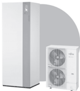
Alféa Excellia Duo A.I. Pompe à chaleur