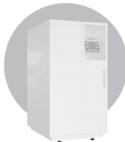
Perfinox 2 Chaudière sol gaz

Nos services en + qui vous font gagner du temps