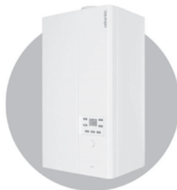
Naema 2 Micro Chaudière murale gaz