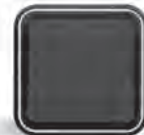
cubyko l'étanchéité parfaite IP55.