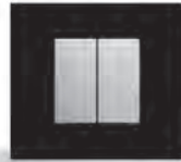
gallery l'appareillage 45x45 pour vos chantiers résidentiels et tertiaires.

Retrouvez l'ingéniosité Hager pour une mise en œuvre facilitée sur vos chantiers résidentiels ou tertiaires, pour du neuf, de la rénovation et du connecté.