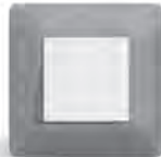
essensya pour un projet résidentiel maîtrisé, avec une touche de couleur.