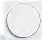
ateha le système complet en saillie pour une rénovation réussie.